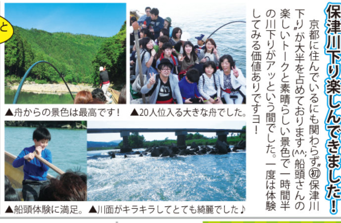
▲舟からの景色は最高です!