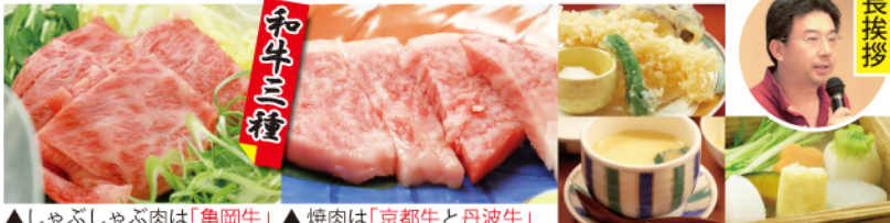
▲しゃぶしゃぶ肉は「亀岡牛」 ▲焼肉は「京都牛と丹波牛」