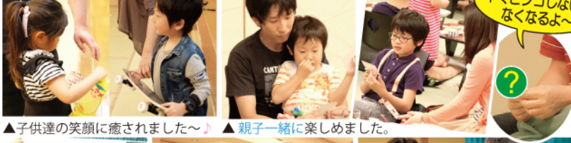
▲子供達の笑顔に癒されました~♪ ▲親子一緒に楽しめました。