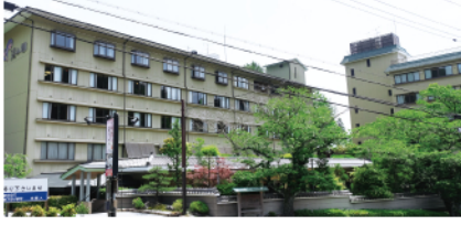
▲亀岡にある湯の花温泉「溪山閣」さん。

二〇一六年 小野工業(株) オリエンテーション 五月一日、社員行事として亀山の溪山閣にてお食事が行われました。社員の家族も参加して七十名近く集まり賑やかな会になりました。小さなお子さんから就職しているようなお子さんまで様々な年齢層が集まりとても新鮮でした。食事後はそれぞれ旅館のお風呂に入ったり、保津川下りに向かったりとバラバラになりましたが、楽しい時間を一緒に過ごせたと思います。