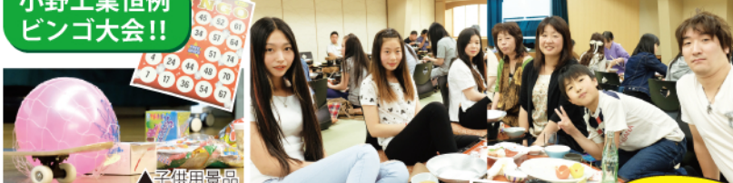
小野工業恒例ビンゴ大会!!