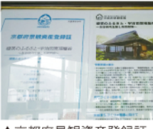
▲京都府景観資産登録証

ちよつとお知らせ 去年の四月に、我が町宇治田原町が「日本茶八〇〇年歴史の散歩」と称して近隣の宇治市・京田辺市など八市町村とともに「日本遺産」に指定されていきました。世界遺産のようにあまり大騒ぎにならなかったため、今頃知った私たちでした(人)