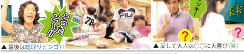
▲最後は総取りビンゴ!!