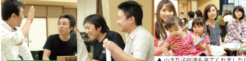
▲小さな子供達も来てくれました!