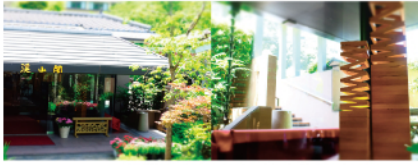
▲新緑がきれいな玄関 ▲お洒落なロビーでした。