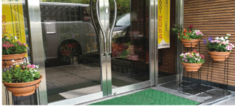
▲本社玄関の両脇に段差のある「花鉢」を備えました。

九月末、本社の玄関前花壇、本社フェンス周りの垣根整備が終了しました。下草に群がる虫の駆除と風通しを良くすることを目的として剪定を行いました。見た目にもスッキリとし光が入り込んで明るくなりました。花壇はヒイラギの木を剪定後、違う種類の花を植え、玄関前と中には、鉢に植えた色とりどりの花鉢を備えました。「本社に来られるお客様の目の安らぎ」になればと願い、継続して行ってきたいと思っております。本社に来られた際には、小さな花壇の花壇を見ていただけたら幸いです。（企画管理部）