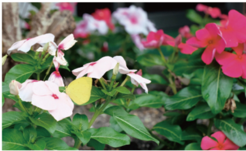
▲花壇が完成した翌日、ヒラヒラと蝶が訪れに来てくれました♪