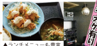
▲ランチメニューも豊富