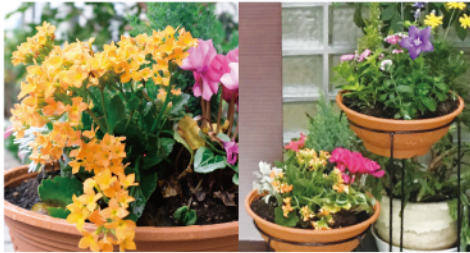
▲色どり豊かな花鉢です ▲玄関中にも花鉢を備えました