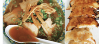
▲醤油ラーメン650円(みそ味も有り)

工業団地内にこんな素敵なお店が6月に開店されました。お財布にも優しくお腹も大満足♡20年以上ラーメン屋さんを営んでおられた方でラーメンは勿論♪定食も餃子も抜群です!!