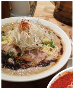
▲ コラーゲンたっぷり ラーメンです!